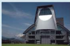
静岡県コンベンションアーツセンター GRANSHIP

駐車場：普通乗用車400台(うち車椅子使用者用7台) 催事の開催状況によっては満車となる場合があります。 できるだけ公共の交通機関をご利用ください。